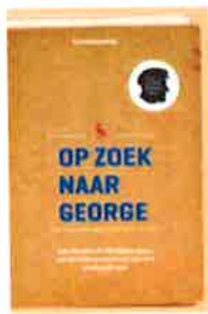
Kim Heijdenrijk Op zoek naar George. Een reis door de twintigste eeuw aan de hand van het leven van een onbekende man (Nederloist den Berg: Uitgeverij Water) 288 blz., ill., € 19,90.

eruit gescheurd. Tijdens haar zoektocht ontdekte Rijk waarom. De kracht van Polderpioniers zit hem niet alleen in de pakkende verhalen en geweldige details die Rijk boven tafel heeft weten te krijgen; het boek is zo goed door-dat Rijk laat zien dat de kwesties waar haar voorouders mee te kampen hadden, in zoveel Nederlandse gezinnen speelden. [EvdP]